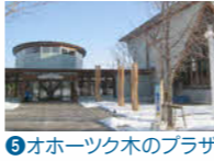
5 オホーツク木のプラザ