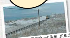
沿着鄂霍次克湾行走的一卡列车 (JR钏网)