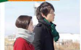
使用航拍机拍摄辽阔的景色及最后的场面