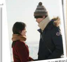
以流冰的背景于船上定爱的盟誓的两人