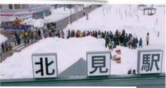
剧中,以北见站登场的建筑物.其实是...