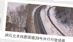
JR石北本线跟国道39号并行行驶场面