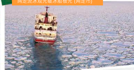
郭在容导演最钟情的流冰场面