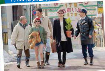
远轻町之夜游热点，两人变装成LEON及Mathilda于街上行走场面