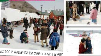
超过200名当地的临时演员参与冬祭场面再现